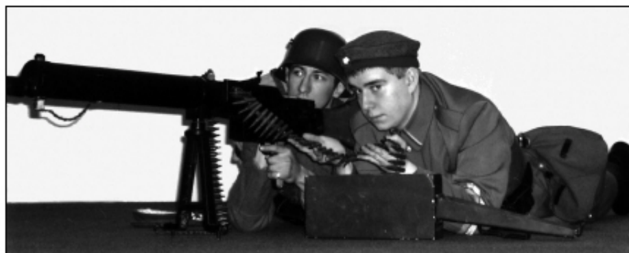
Fot. 7. Grupa Rekonstrukcji Historycznej „Grolman”

Powstanie bardzo szybko ogarnęło całą Wielkopolskę – powstańcom zajęło to zaledwie kilkanaście dni. Pierwszą fazę powstania czasami określa się terminem „działań spontanicznych”. Nie kierowało nimi odgórne dowództwo – wręcz przeciwnie, były to działania oddolne. Rozwijały się niesłuchanie żywiolowo, co świadczyło o ogromnej chęci oderwania Wielkopolski od Niemiec i przyłączenia jej do Polski. Ze strony ośrodka centralnego zabrakło jakiegokolwiek koordynacji działań lokalnych. Zdarzało się nawet, że działania te prowadzono wbrew woli władz i jakiegokolwiek wsparcia z ich strony. Często Rady Ludowe ograniczały swą działalność do wprowadzania zmian w szkolnictwie, czy też do powołania służb porządkowych. Postępowały one zgodnie z polityką Komisariatu NRL, który sprzeciwiał się działaniom zbrojnym, gdyż liczył, że sprawę polską rozstrzygnie politycznie konferencja pokojowa, z korzyścią dla Polaków.