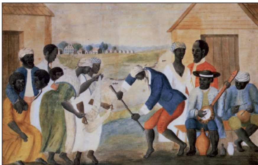
Prehistoria jazzu, wzorcowego przykładu hybrydycznego zjawiska kulturowego. Ilustracja z końca XVIII wieku przedstawia afrykańskich niewolników w Ameryce podczas tańca i gry na banjo i bębnie

Nieczyste sumienie właścicieli niewolników kazało im przynajmniej szerzyć wśród sprowadzonych Afrykanów chrześcijaństwo. Niewolnicy stawali się więc chrześcijanami, na początku tylko powierzchownie. Nowe treści chrześcijańskiej religii, nowe formy współżycia społecznego, wymuszone okolicznościami, nowe wzorce muzyki zasłyszane od białych nałożyły się na afrykańskie dziedzictwo. Z początku elementy różnych kultur jedynie współistniały obok siebie, tworząc mieszankę. Takie wymieszanie różnorodnych kultur nazywamy synkretyzmem kulturowym . Synkretyzm kulturowy był cechą specyficzną np. późnoantycznego społeczeństwa rzymskiego.