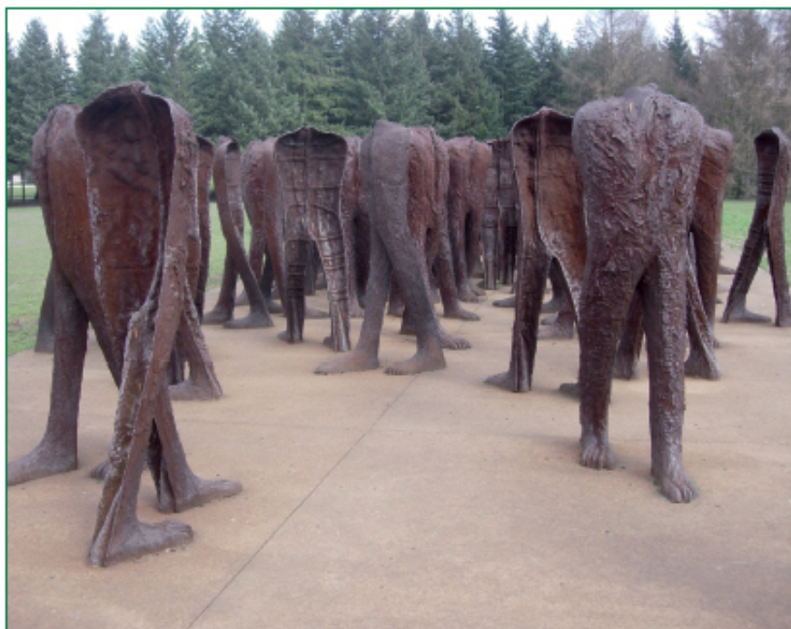
Magdalena Abakanowicz, instalacja Nierozpoznani, park Cytadela w Poznaniu

Neodadaistyczne inspiracje, niezwykle oryginalny stosunek do przedmiotu, formy asamblażu oraz impulsów płynących ze strony pop-artu określiły charakter twórczości Władysława Hasióra (1928–1999). Tworząc swoje rzeźby, sztandary, konstrukcje z przedmiotów znalezionych czy projekty scenograficzne, Hasiór obracał się w niezwykle szerokim świecie wyobrażeń, od sposobów życia polskiej wsi i elementów folkloru religijnego po idee skrajnie awangardowej i poawangardowej sztuki. Poawangardowe formuły artystyczne wyznaczają także charakter twórczości Magdaleny Abakanowicz (ur. 1930) – od sławnych, trójwymiarowych konstrukcji z tkanin, zwanych „abakanami”, począwszy, po tworzone przez artystkę na całym świecie ekspresyjne grupy postaci ludzkich, często niekompletnych i umieszczanych w niepowtarzalnej przestrzeni określonego miasta.