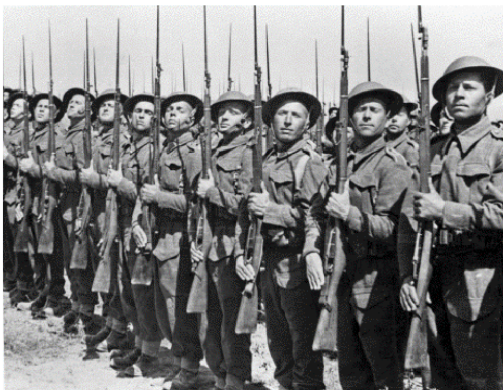
Fot. 11. II Korpus Polski i junacy na Bliskim Wschodzie

Żołnierze Armii Polskiej na Wschodzie mieli takie samo umundurowanie, jak wcześniej Samodzielna Brygada Strzelców Karpackich, z tą różnicą, że we Włoszech latem rzadziej noszono szorty. Podczas walk w górach włoskich używano białych kombinezonów ochronnych. Pancerniacy nosili mundury drelichowe, battle-dressy i kombinezony czołgowe. Żołnierze polscy odróżniali się naszywką „Poland”. Podstawowym nakryciem głowy początkowo były drelichowe lub sukienne furażerki, które od wiosny 1944 r. stopniowo zastępowano beretami khaki. Pancerniacy i żołnierze pułków kawalerii nosili berety w kolorze czarnym, a komandosi – zielonym. Podstawowym bojowym nakryciem głowy były angielskie hełmy Mk. 2 . Motocykliści otrzymali hełmy A.T. Mk. 2 , a załogi czołgów amerykańskie hełmy czołgowe.