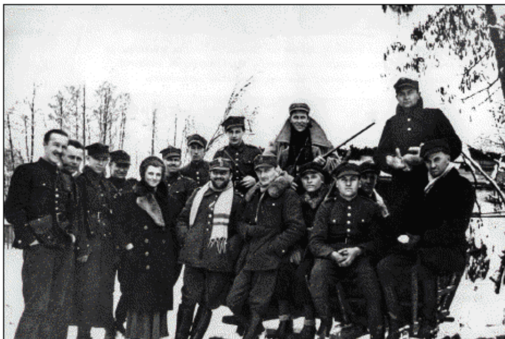
Fot. 5. Major Henryk Dobrzański ps. „Hubal” w otoczeniu żołnierzy

Mjr Dobrzański opracował plan tworzenia ochotniczych, kadrowych oddziałów Wojska Polskiego, dla którego uzyskał aprobatę gen. Michała Tokarzewskiego-Karaszewicza, dowódcy głównego Służby Zwycięstwu Polski, utworzonej jeszcze we wrześniu 1939 r. W 1940 r. zaczęły powstawać kadrowe drużyny strzeleckie, mające